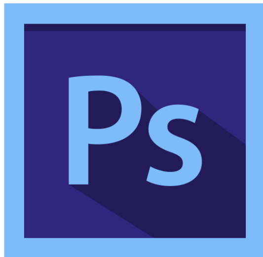
Photoshop – 50 000 руб.