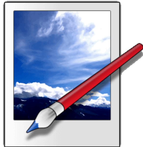
Paint.net - бесплатно