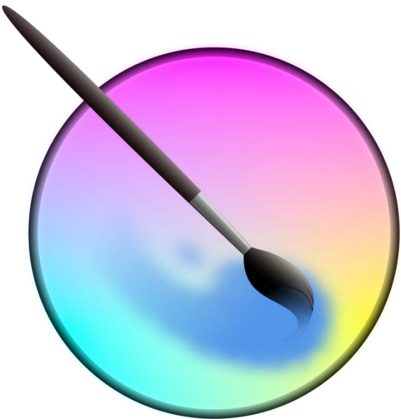
Krita - бесплатно